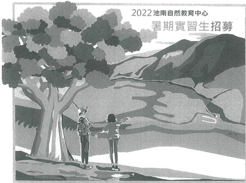
走入洄瀾時光森林，體驗低海拔山水之美，實踐友善環境生活

花蓮林區管理處為促進池南自然教育中心與大專院校學術機構合作，開創青年學子一個嶄新的學習環境，藉由理論與實務結合之培訓課程，提供學生參與環境教育及志願服務管道，以培育未來環境教育專業從業人員為目標，特訂定本計畫